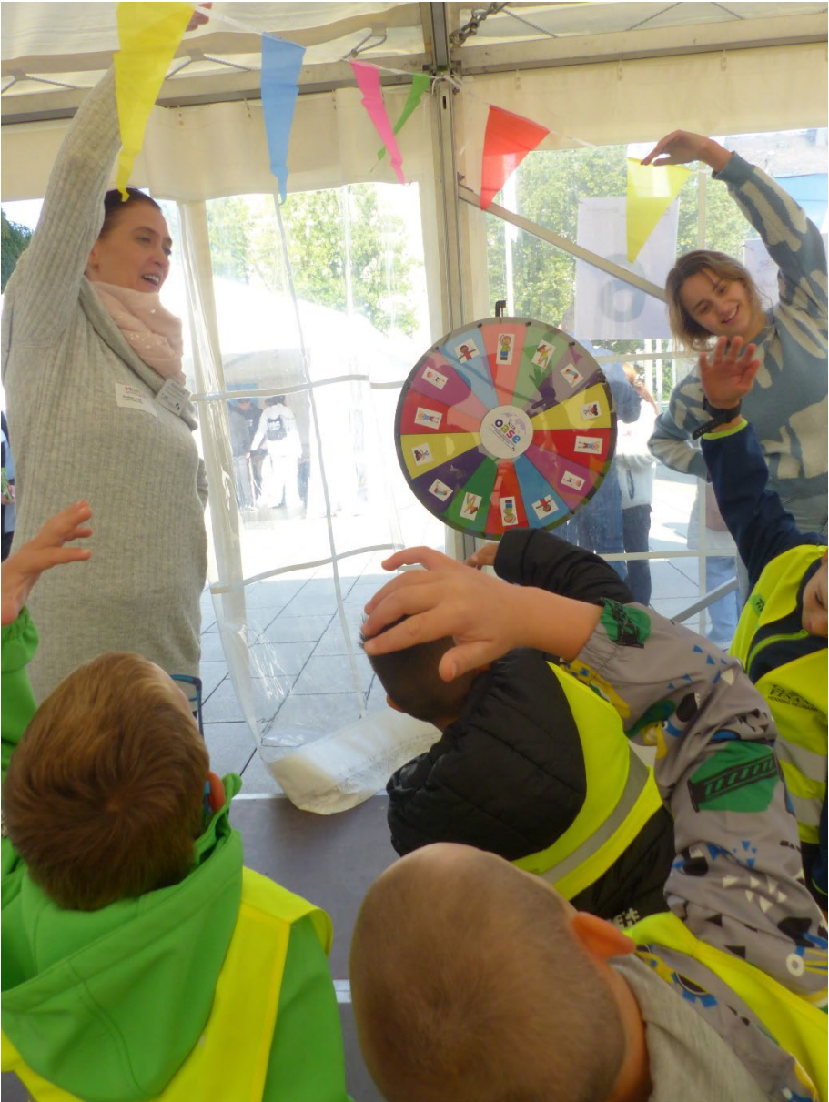
Das Team des Kindergartens Müsen